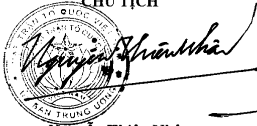
Nguyễn Thiện Nhân

TM. ĐOÀN CHỦ TỊCH ỦY BAN TRUNG ƯƠNG MẶT TRẬN TỔ QUỐC VIỆT NAM CHỦ TỊCH